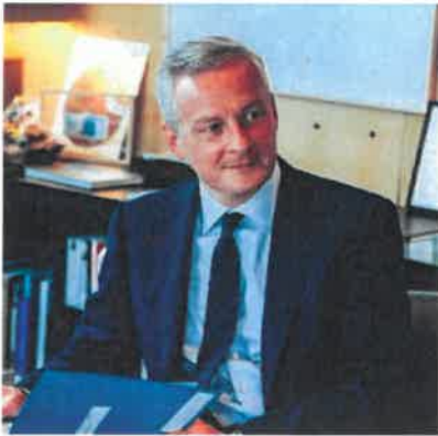
Bruno Le Maire, ministre de l'Économie, des Finances et de la Relance.

Les entreprises et leurs salariés sont le cœur battant de l'économie française. La décision de les protéger « quoi qu'il en coûte » était le seul choix responsable.