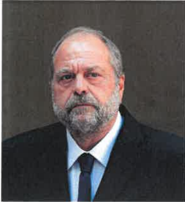
Éric Dupond-Moretti, garde des Sceaux, ministre de la Justice.

En cette période de sortie de crise, où l'Etat continue plus que jamais d'être aux côtés de nos entreprises, je suis convaincu que la justice a un rôle majeur à jouer pour soutenir toutes celles et ceux qui, individuellement ou collectivement, font au quotidien notre économie et contribuent à sa croissance.